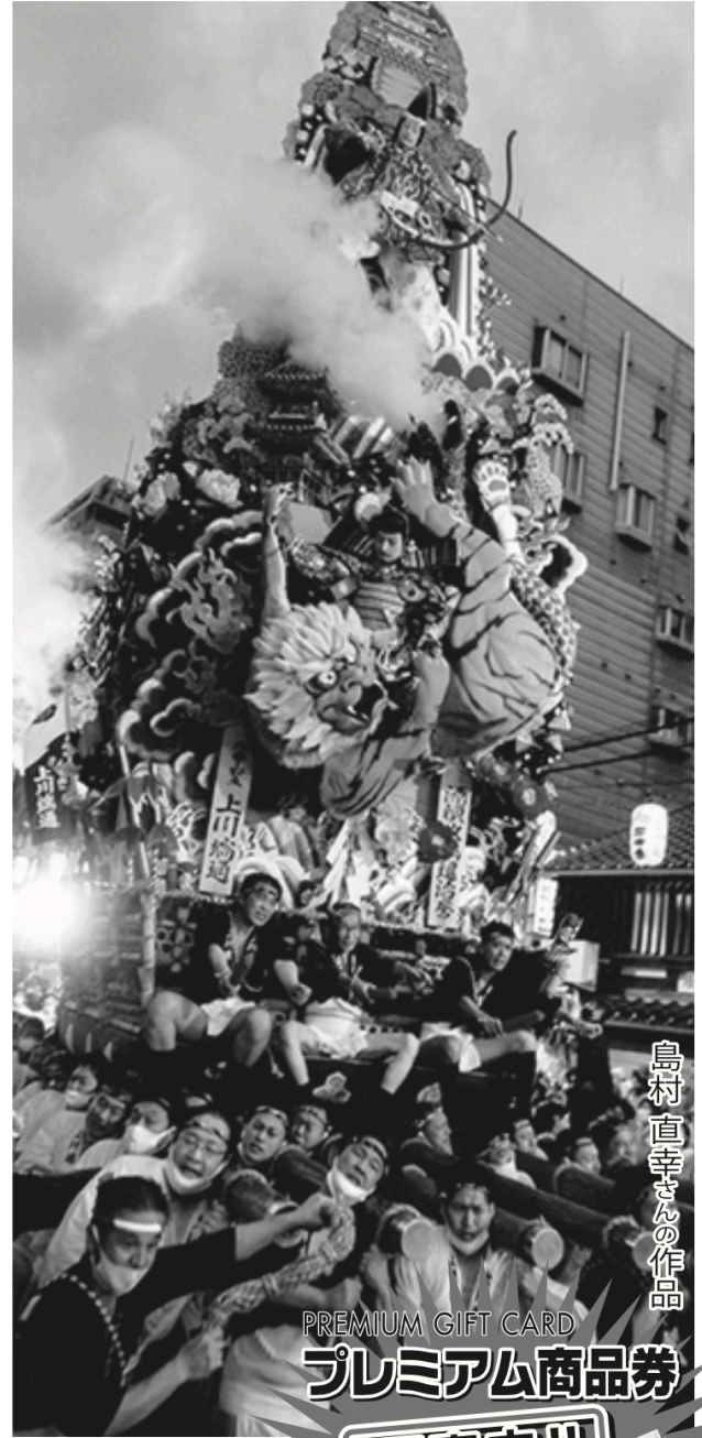
島村直幸さんの作品